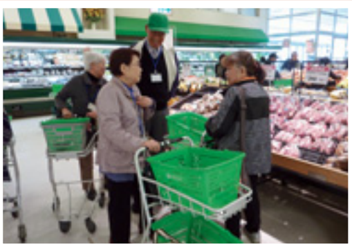
住民同士の支え合いによる買い物支援の様子